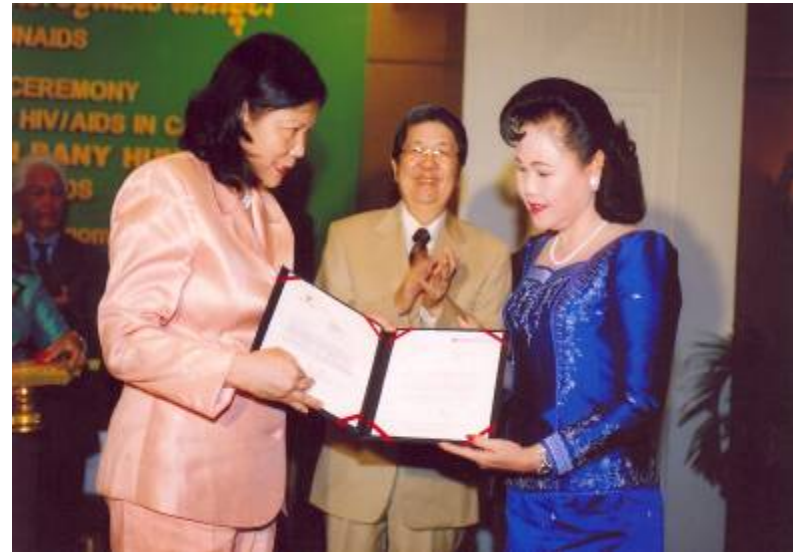
LCT BUN RANY HUNSEN-APLF recognized as National Champion on HIV/AIDS, Cambodia